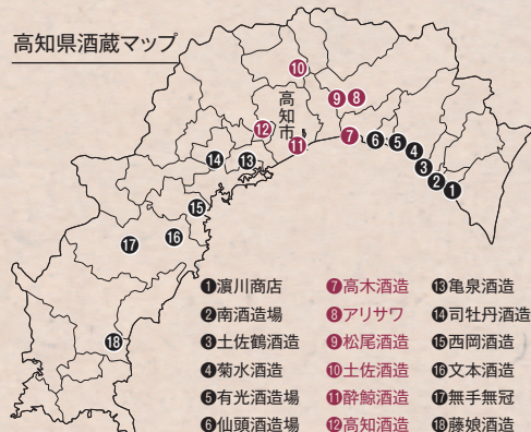
高知県酒蔵マップ