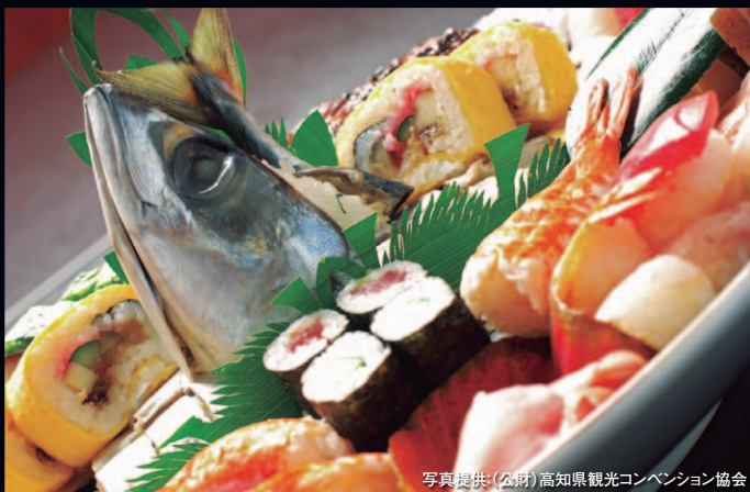
高知の皿鉢は刺身、組み物、寿司と鯉のタタキの4皿が人気

もともとは大勢の客に出す宴席料理として受け継がれてきましたが、最近では少人数でも食べられる“ミニ皿鉢”を用意する料理店もあります。グルメクーポンを使って、相性抜群の地酒とともに、豪快な「土佐の宴会スピリット」をお楽しみください。