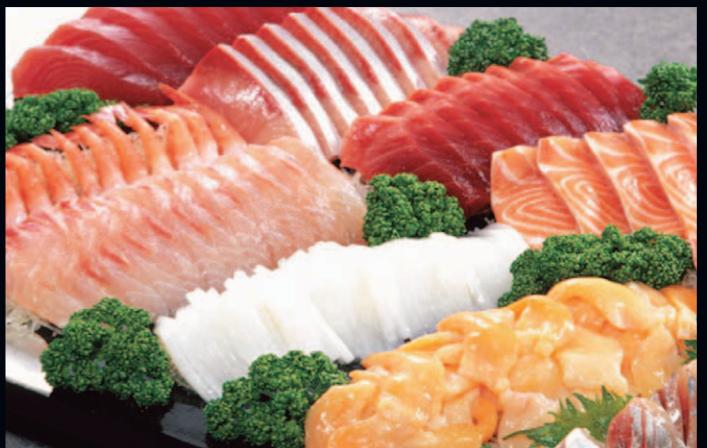
刺身の盛り合わせはどれも新鮮