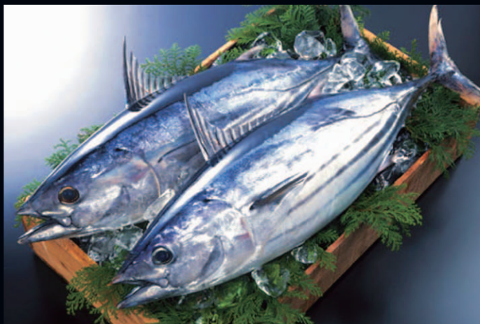
戻り鰹は9月から11月が旬

グルメクーポンを使って、鰹王国ならではの、それぞれのお店の工夫を凝らした“鰹のタタキ”をお楽しみください。