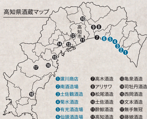
高知県酒蔵マップ