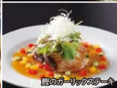
鰹のガーリックステーキ

分厚〜いカツオのタタキが自慢ぜよ。土佐高知の郷土料理から一味違う宴会料理まで。県外のお客様でも入りやすい雰囲気と旨い料理で高知の夜の思い出を♪地産地消にこだわり、高知の食材をふんだんに味わって下さい。カツオは有名ですが、高知のウツボも絶品です。また、地酒も豊富に取りそろえております。お食事コースもご用意しております。