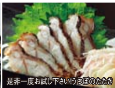
是非一度お試し下さい!旬のたたき