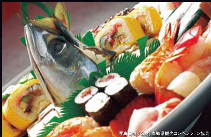
高知の皿鉢は刺身、組み物、寿司と鯉のタタキの4皿が人気

もともとは大勢の客に出す宴席料理として受け継がれてきましたが、最近では少人数でも食べられる“ミニ皿鉢”を用意する料理店もあります。グルメクーポンを使って、相性抜群の地酒とともに、豪快な「土佐の宴会スピリット」をお楽しみください。