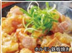
ホルモン鉄板焼き