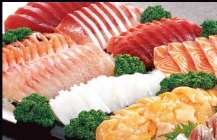
刺身の盛り合わせはどれも新鮮