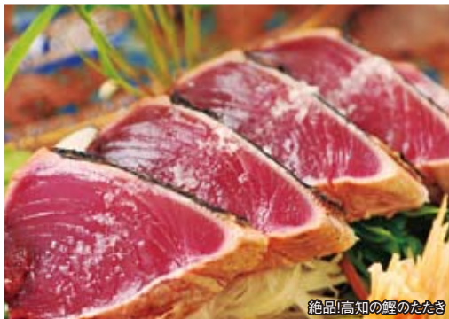
絶品!高知の鰹のたたき

新鮮で絶品のカツオをご用意しております! 日替わりのおすすめ鮮魚も大人気です! 大好評の晩酌セットもアンコールにて復活!