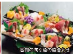
高知の旬な魚の盛合わせ